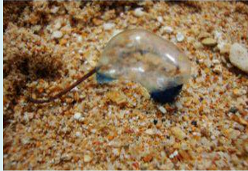
ලොඩියා - Jelly fish

ලොඩියන්ගේ දෂ්ඨන නිසා සිදුවන විෂවීම් වසර පුරා වාර්තා වේ. මොවුන් දිගු ග්‍රාහිකා සහිත විනිවිද පෙනෙන සිරුරකින් යුක්තය. මෙම ග්‍රාහිකා තුල ඇති විෂ සහිත සෛල ආධාරයෙන් විෂ වීම් සිදු වේ.