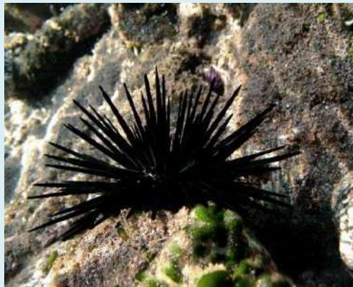
මුහුදු ඉකිරි - Sea Urchin

ජාතික විෂ තොරතුරු මධ්‍යස්ථානය ශ්‍රී ලංකා ජාතික රෝහල කොළඹ